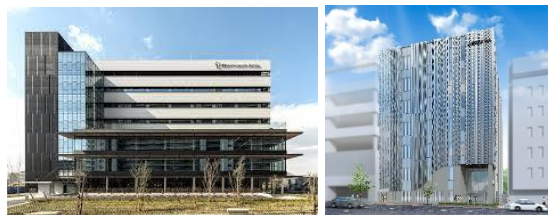
J. NODE Lab 健都