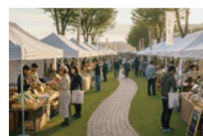
日常に開かれた交流機会のイメージ