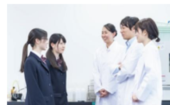
学びと交流機会のイメージ