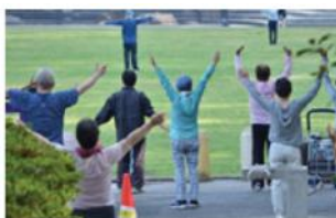
健康の体験・実践機会のイメージ

敷地内には、地域との接点となる「街角広場」を計画しています。研究開発機能に加え、地域に開かれた空間を設けることで、入居企業、研究機関、地域の方々が自然に接点を持つ機会を生み出し、健都ならではの交流・共創を促します。街角広場を、研究開発拠点と地域をつなぐ場として活用することで、健都におけるオープンイノベーションの創出や、市民の健康行動につながる機会の創出を目指します。