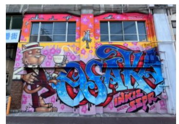
“Artwork by Inkie,”