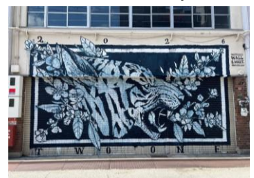
“Artwork by TWOONE,”