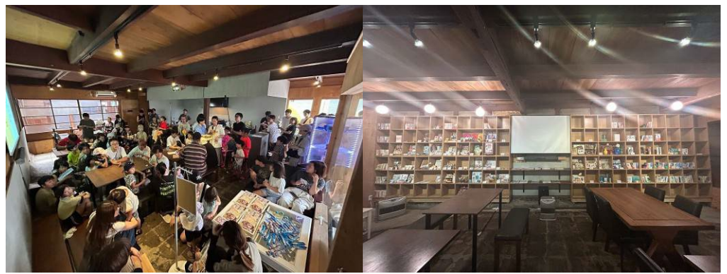
新町商店街「Tsunaga Room」出張版。全国のクリエイターが集う「ハコカラ」の一部をご覧いただけます▲

福知山公立大学の学生による多彩な取り組みが一堂に集結。週替わりでさまざまなイベントを展開し、トレンドと地域創生が融合した挑戦をご紹介します。計画です。