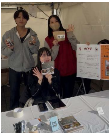
B 型就労支援施設と食品ロス削減の取り組みから生まれた「オリブフィナンシェ」の試食を実施▲