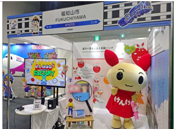
「大阪・関西万博」福知山市ブースで展示した、本学開発の体験型コンテンツを体験▲