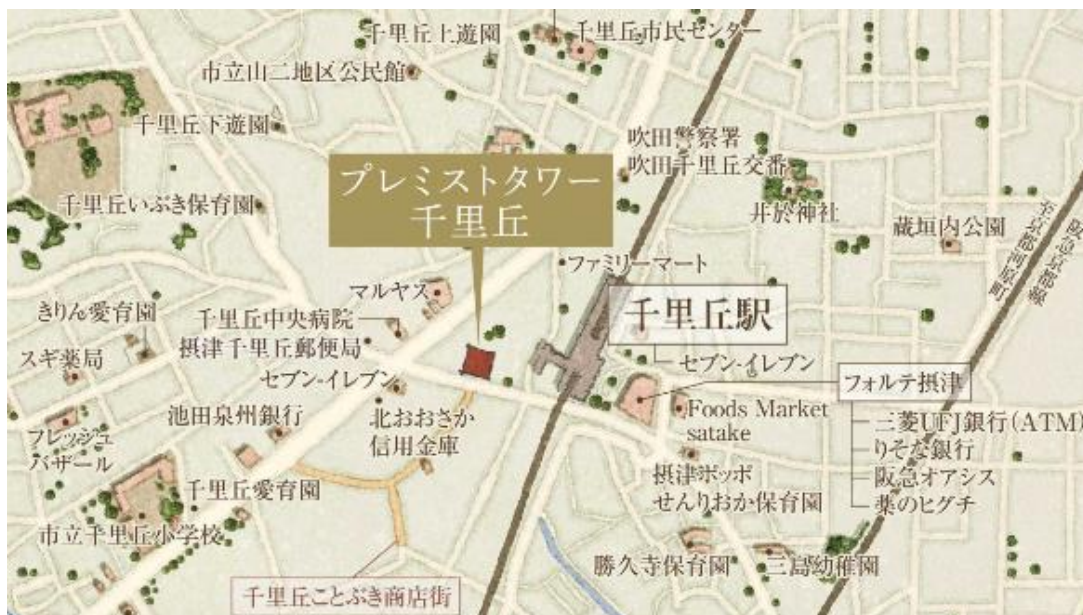
「プレミスタワー千里丘」周辺地図

※5. 国土交通省が公布した「建築物のエネルギー消費性能の向上に関する法律」で定める基準建物