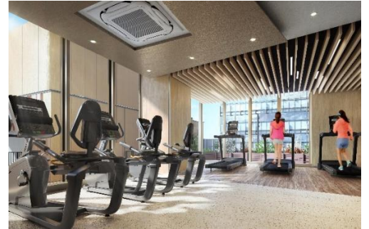
【フィットネスルーム】