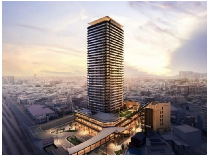
【「プレミストタワー千里丘」パース図】

なお、2025年1月中旬にモデルルームをオープンさせ、3月より販売を開始する予定です。