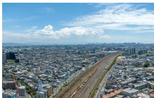
【南側の部屋から見える大阪市の景色】

※2. 「プレミスタタワー千里丘」からの眺望・景観は各階や各住戸で異なり、今後周辺環境の変化に伴い将来にわたって保証するものではありません。また、花火については打ち上げ場所の変更や開催中止になる場合があります。住戸の向きや階数によって花火の眺めは異なります。本表示は販売住戸などから花火が見えることを保証するものではありません。