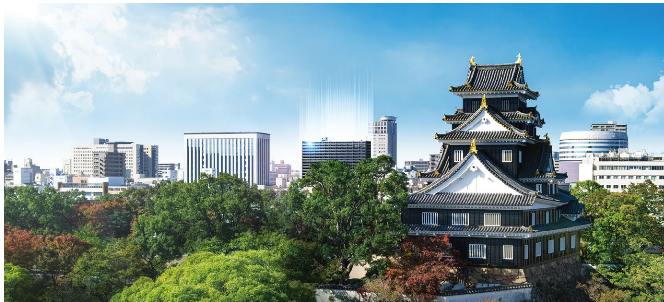
岡山城からの本計画外観