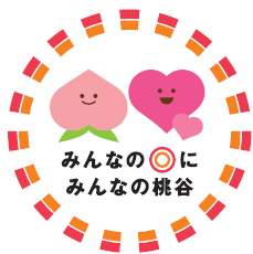
大阪環状線改造プロジェクト